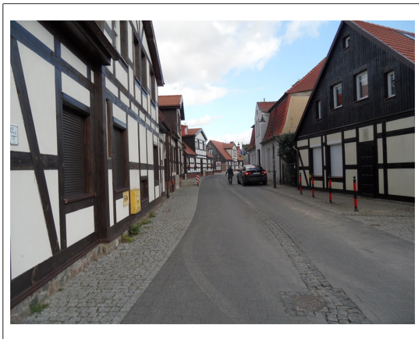
Starówka Ustki, ul. Czerwonych Kosynierów. 2020