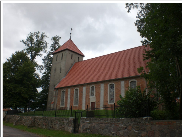
Fot. 18. Budowo, kościół NMP.