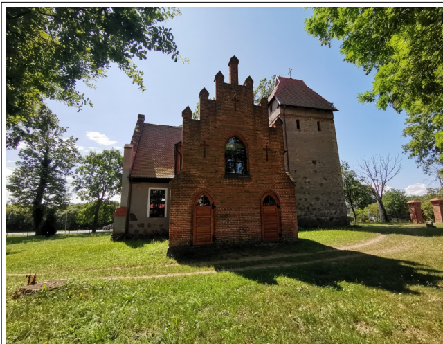
Fot. 27. Grabno, kościół widziany od północnego- wschodu

4. P. Maliszewski, Zabytki..., z.6, s.28. Datowanie: ok. poł. I ! XVIw. 5. Schematyzm..., s.346-47. Datowanie: ok. poł. XVIw.