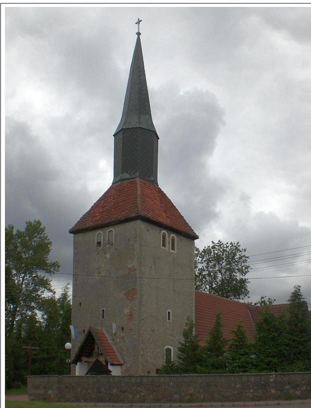
Fot. 21. Dębica Kaszubska, kościół pw św. Jana Chrzciciela- Wikipedia