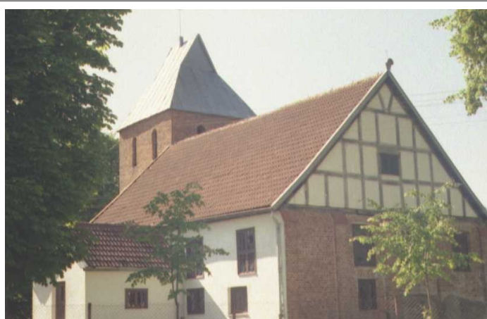
Fot. 31. Mozdzanowo, kościół widok od południowego- wschodu