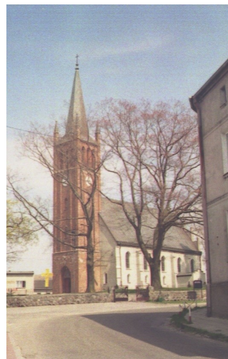
Fot. 26. Gardna Wielka, kościół widziany od południowego- zachodu