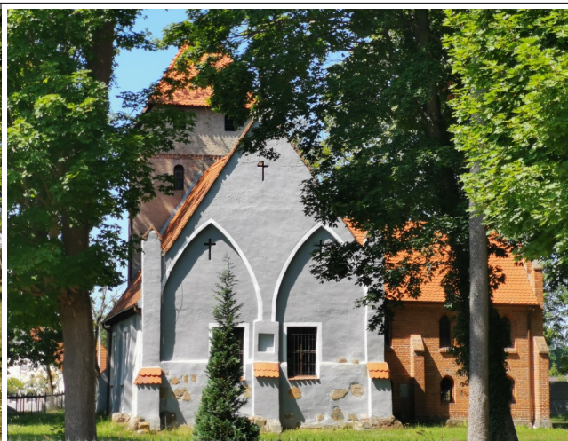
Fot. 28. Grabno, kościół widziany od wschodu