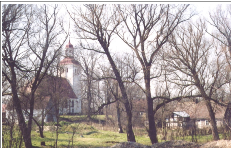
Fot. 23. Duninowo, kościół od północnego- wschodu