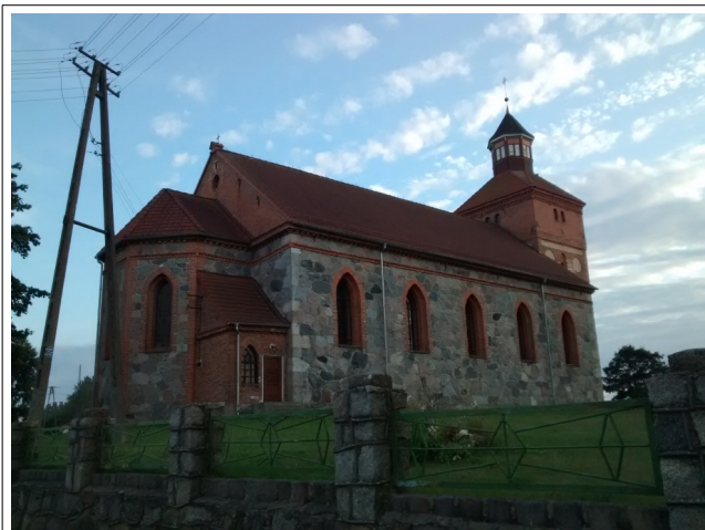
Fot. 29. Kwakowo, kościół pw Niepokalanego Poczęcia NMP