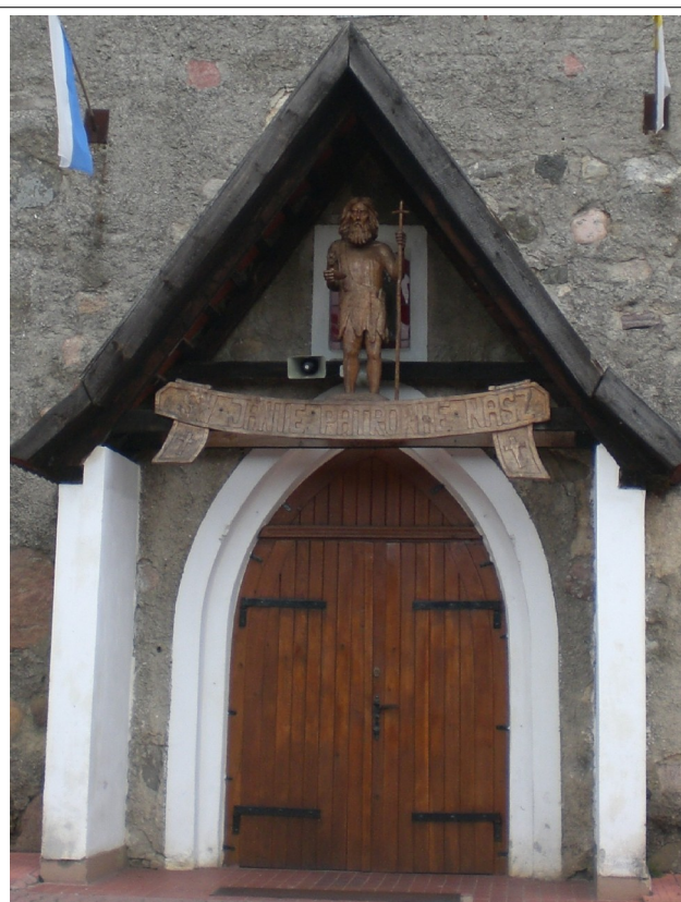
Fot. 22. Dębica Kaszubska, kościół pw św. Jana Chrzciciela