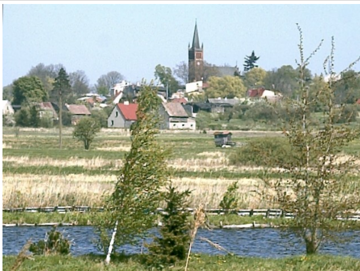
Fot. 25. Gardna Wielka, kościół widziany od południa