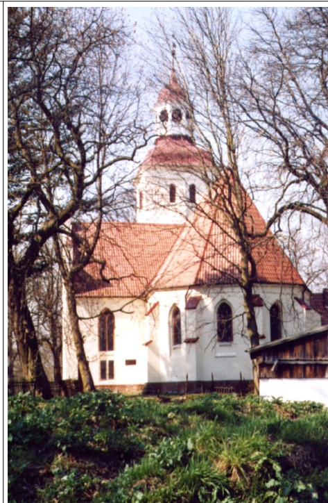
Fot. 24. Duninowo, kościół od wschodu