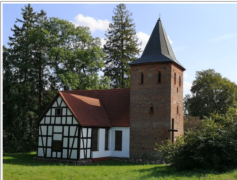
Fot. 19. Charnowo, kościół widziany od północy

6. Schematyzm..., s.346. Datowanie: XVw.