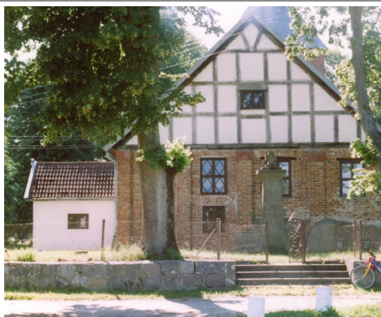
Fot. 30. Mozdzanowo, kościół widok od wschodu