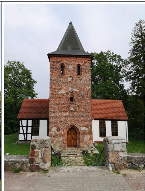
Fot. 20. Charnowo, kościół widziany od zachodu