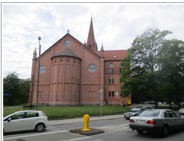
Fot. 1. Kościół pw. Najświętszego Serca Jezusowego w Słupsku widziany od wschodu, 2019

artykuł pt.: O kamieniu stepowym i grodziskach.