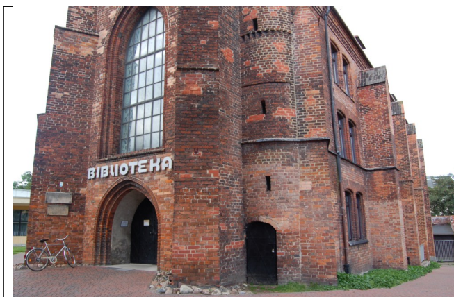
Fot. 5. Słupsk, dawny kościół pw św. Mikołaja, obecnie biblioteka- wejście, 2007