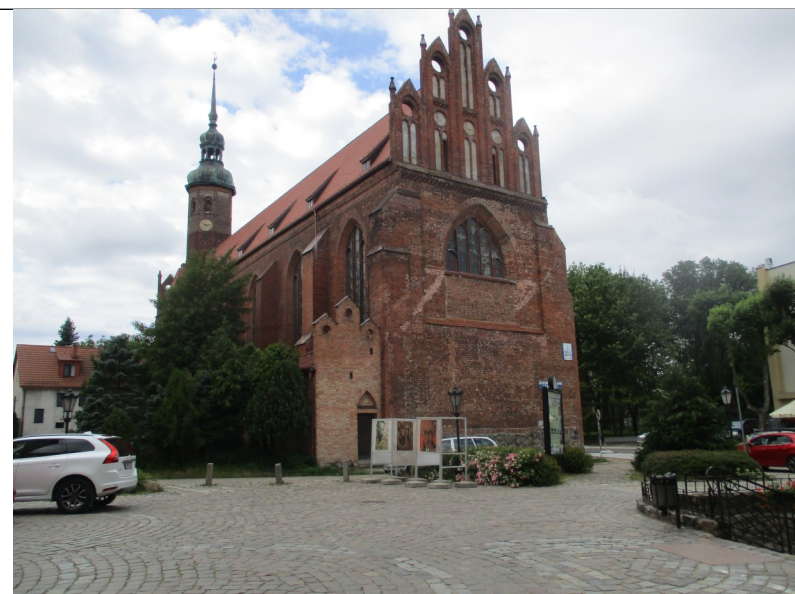
Fot. 9. Słupsk, kościół pw św. Jacka, widok od południowego- wschodu, 2019