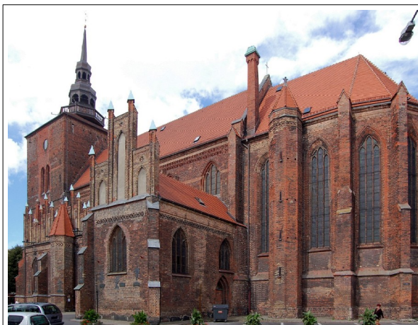
Fot. 13. Słupsk, kościół Najświętszej Marii Panny,