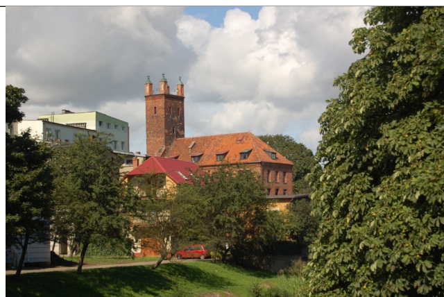
Fot. 6. Słupsk, dawny kościół pw św. Mikołaja, obecnie biblioteka- widok od południa, 2007