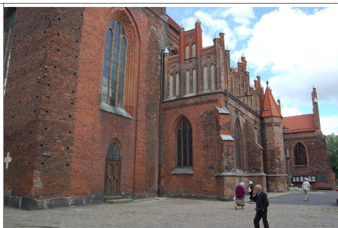
Fot. 14. Słupsk, kościół Najświętszej Marii Panny,