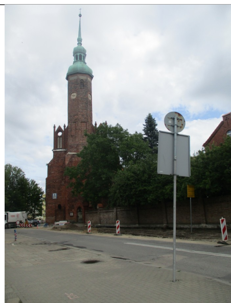
Fot. 10. Słupsk, kościół pw św. Jacka, widok od południowego- zachodu, 2019