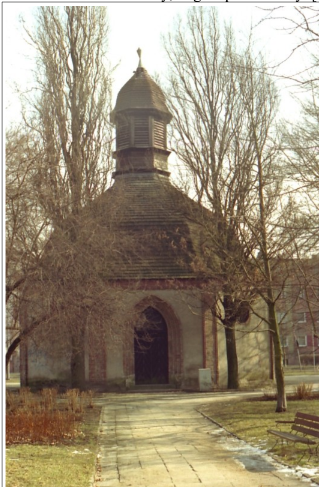
Fot. 11. Słupsk, kaplica św. Jerzego, 2006

wnęką w grubości muru od północnego- wschodu. Elewacje ujęte ramami z kształtek: trójwałkowej, wydzielającej lizeny w narożach, półwałkowej w cokole i gzymsie wieńczącym oraz wałkowej i wklęsłej u podstawy listwy pod gzymsem. Okna koliste w obramieniach półwałkowych. Portal zachodni czterouskokowy, bogato profilowany. [...]