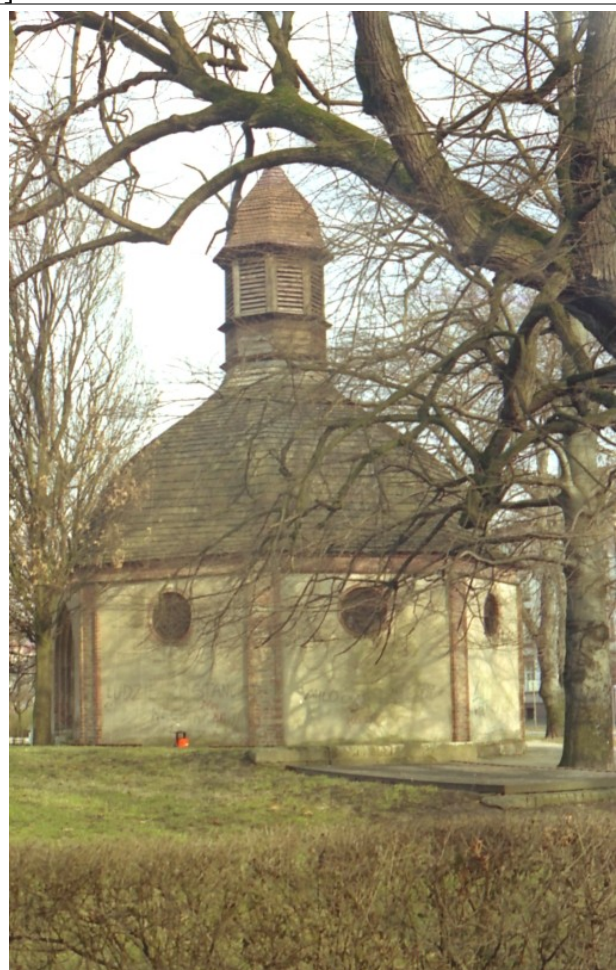
Fot. 12. Słupsk, kaplica św. Jerzego, 2006