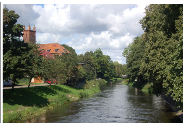
Fot. 3. Słupsk, dawny kościół pw św. Mikołaja, obecnie biblioteka- przy Słupi, 2007

W marcu 1945 roku, zaraz po wejściu Armii Czerwonej do Słupska żołnierze tej armii podpalili słupską starówkę. Doszczętnie wypaliło się wewnątrz i spalił się dach dawnego kościoła św. Mikołaja. Od 1955 roku zaczęto sporządzać plany odbudowy miejskiej słupskiej starówki. W opiniach konserwatora zabytków z początku lat sześćdziesiątych XX w. ruina kościoła św. Mikołaja miała pozostać odbudowana w swoim średniowiecznym wyglądzie. Projekt odbudowy kościoła został sporządzony w 1962 roku dawny kościół został przeznaczony na powiatową i miejską bibliotekę. Odbudowę rozpoczęły po wcześniejszym odgruzowaniu prace ziemne podjęte w 1965 r. Uroczyste otwarcie biblioteki po odbudowie miało miejsce 10 września 1971 roku. 9