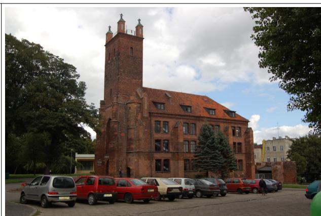
Fot. 4. Słupsk, dawny kościół pw św. Mikołaja obecnie biblioteka- widok od południa, 2007