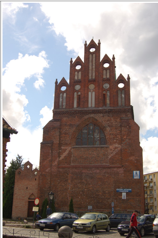
Fot. 8. Słupsk, kościół pw św. Jacka, widok od wschodu, 2007