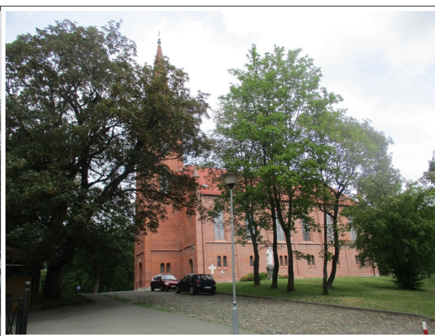
Fot. 2. 1. Kościół pw. Najświętszego Serca Jezusowego w Słupsku widziany od południa, 2019