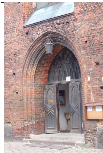
Fot. 15. Słupsk, kościół Najświętszej Marii Panny, portal wejścia głównego, 2007