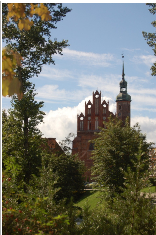
Fot. 7. Słupsk, kościół pw św. Jacka, widok od wschodu, 2007

Kościół posiada długość około 28 metrów, szerokość 8,5 metra a wysokość wnętrza 15 metrów. Kościół nakrywa wspólny dach dwuspadowy. Na zewnątrz prezbiterium opięte jest sklepieniami gwiaździstymi i rozczłonkowane przyściennymi uskokowymi arkadami.